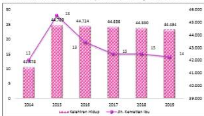
Gambar 2.1 Jumlah Kematian Ibu di Kabupaten Deli Serdang Tahun 2014-2019

Sumber: LKIP Dinas Kesehatan Kabupaten Deli Serdang Tahun 2019