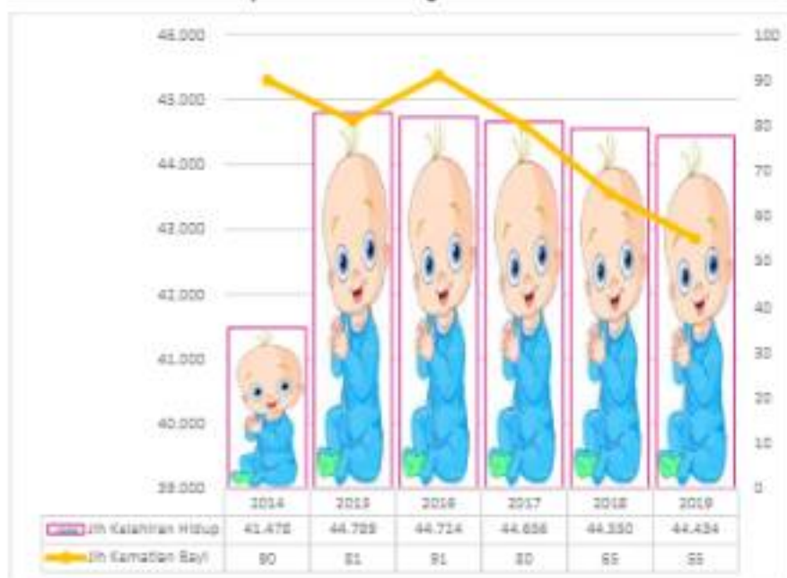
Gambar 2.2 AKB Kabupaten Deli Serdang Tahun 2014 – 2019